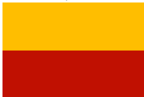
Moravská vlajka žlutočervená