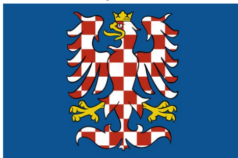
Moravská vlajka heraldická