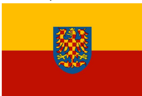
Moravská vlajka žlutočervená se znakem