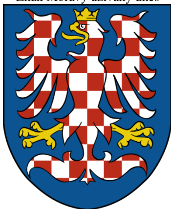
Znak Moravy užívaný dnes